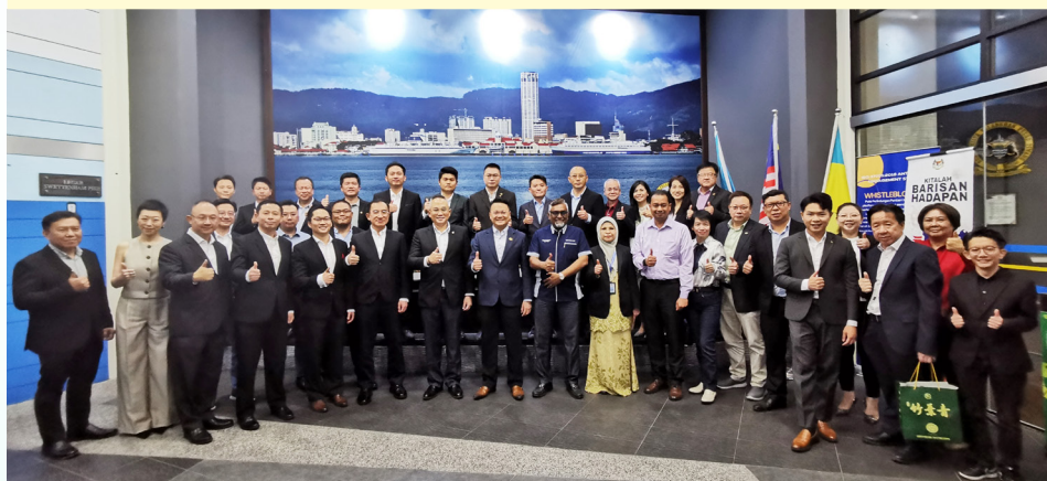
◀ 槟中总董事及会员与槟城港务局主席拿督杨顺兴、总经理拿督威再耶及港务局同仁一起大合影。