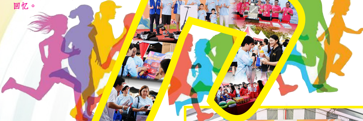
▼ 本会董事及青商团执委与槟岛市长拿督拉詹德兰(左九)合影留念。