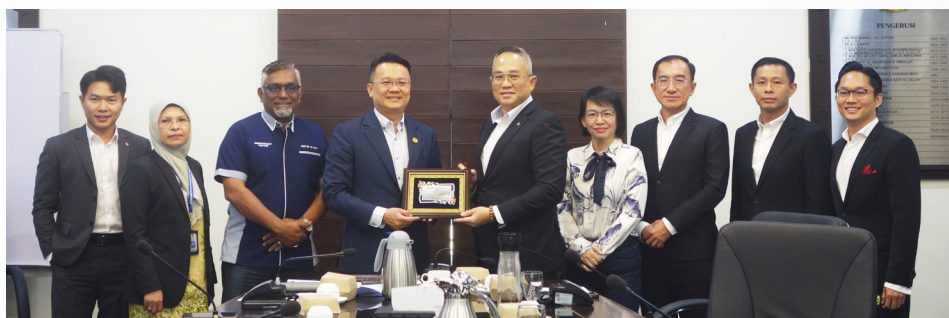
▲ 槟中总与槟城港务局互致纪念品，以示友好与合作情谊。

通过此次交流，双方都受益匪浅，不仅加深了相互的理解，也为后续更广泛的顺畅合作奠定了坚实基础。此次访问的成功，不仅标志着槟城港口民主化和务实化发展进入新的阶段，还充分体现了商会在政府和业界之间重要的桥梁作用，促进槟城港口和贸易的良性发展，从而为推动区域经济的繁荣和建立健康生态开辟了新的格局。