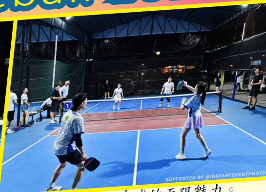
“参与者在球场上挥洒汗水，享受匹克球的无限魅力。”